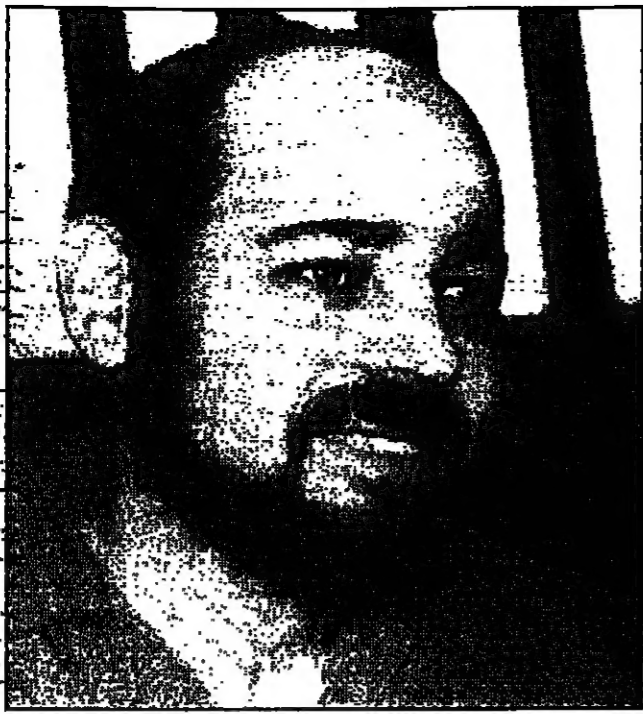
مرسى ابو مرزوق